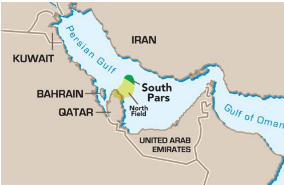
Güney Pars Sahası

Bu projenin hayata geçirilmesine engel teşkil etme bakımından, Güney Pars Sahası gazının Doğu Akdeniz'den Avrupa'ya ulaşması konusunda şii ve sünni iki boru hattı projesinin ortaya çıkması ve birbiriyle çatışmasının büyük rolü olmuştur. Dünyadaki kanıtlanmış gaz rezervleri içerisinde İran'ın 31,9 trilyon m 3 , Katar'ın 24,7 trilyon m 3 kaynağa sahip olduğu bilinmektedir. Bu iki ülke rezervlerinin büyük kısmı İran ile Katar'ın müştereken paylaştığı Güney Pars Doğalgaz Sahası olarak bilinen offshore alandadır. Tahminlere göre bu sahada İran'ın payı 14,2 trilyon m 3 , Katar'ın payı ise 25,4 trilyon m 3 olup, sahanın toplam gaz rezervi Rusya'nın toplam gaz rezervinden daha fazladır.