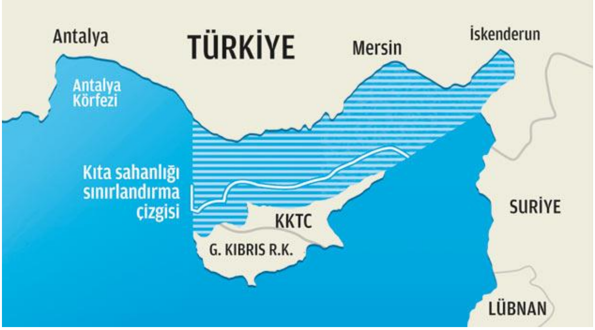
Kıta Sahanlığı Sınırlandırma Çizgisi

Türkiye dış sınırlarını MEB yerine “kıta sahanlığı” prensibi ile belirlemiştir. 18 Mart 2019’da BM’ye gönderilen mektupla Doğu Akdeniz kıta sahanlığı sınırlarımız, doğuda 32 derece, 16 dakika, 18 saniye Doğu Meridyeni ile 28 derece Batı Meridyeni olarak tespit edilmiş ve Mısır ile Türkiye deniz yetki alanının ortay hattı Türkiye'nin kıta sahanlığı hudutları olarak tespit ifade edilmiştir. Ayrıca, 28 derece boylamının batısı da müteakip sınırlamalara tabi olacaktır.