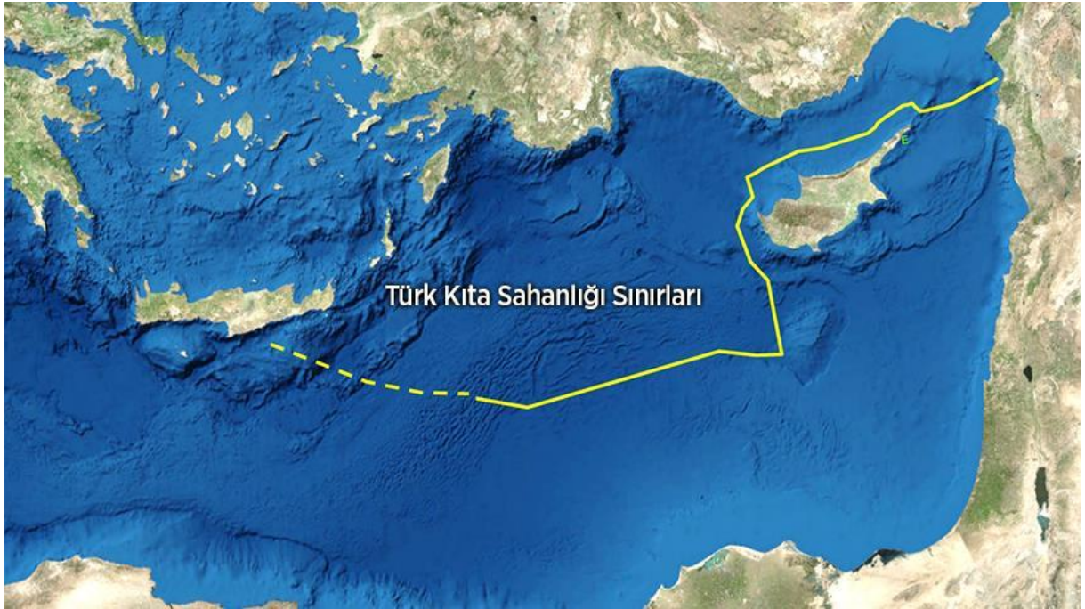
Türk Kıta Sahanlığı

Türkiye dış sınırlarını MEB yerine “kıta sahanlığı” prensibi ile belirlemiştir. 18 Mart 2019’da BM’ye gönderilen mektupla Doğu Akdeniz kıta sahanlığı sınırlarımız, doğuda 32 derece, 16 dakika, 18 saniye Doğu Meridyeni ile 28 derece Batı Meridyeni olarak tespit edilmiş ve Mısır ile Türkiye deniz yetki alanının ortay hattı Türkiye'nin kıta sahanlığı hudutları olarak tespit ifade edilmiştir. Ayrıca, 28 derece boylamının batısı da müteakip sınırlamalara tabi olacaktır.